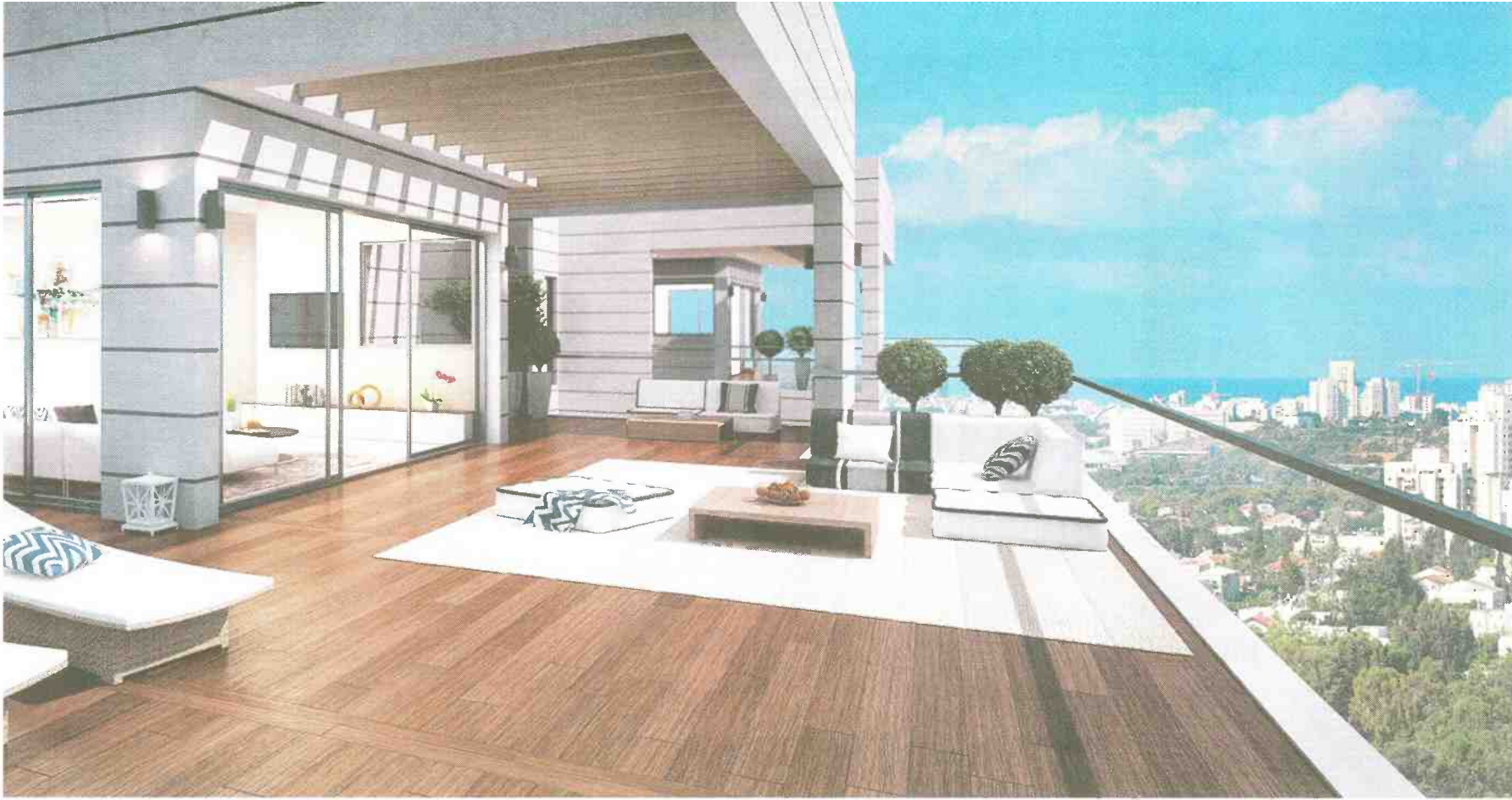
פנטהאוז בפרויקט ME (הדמיה)