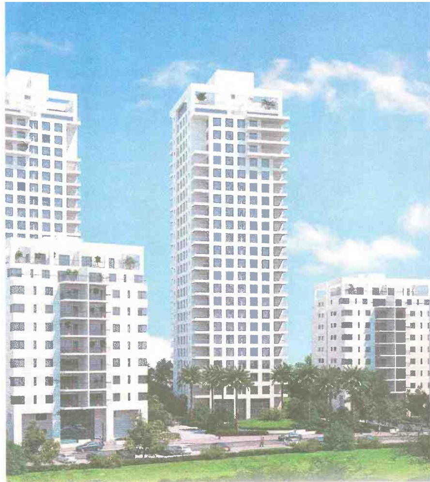
פרויקט קדמת צהלה (הדמיה)